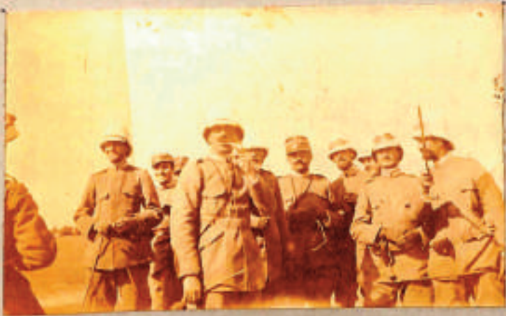
Ufficiali del Battaglione Granatieri