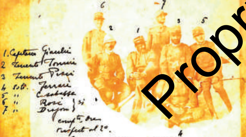
Gli ufficiali della 11 a al loro campo