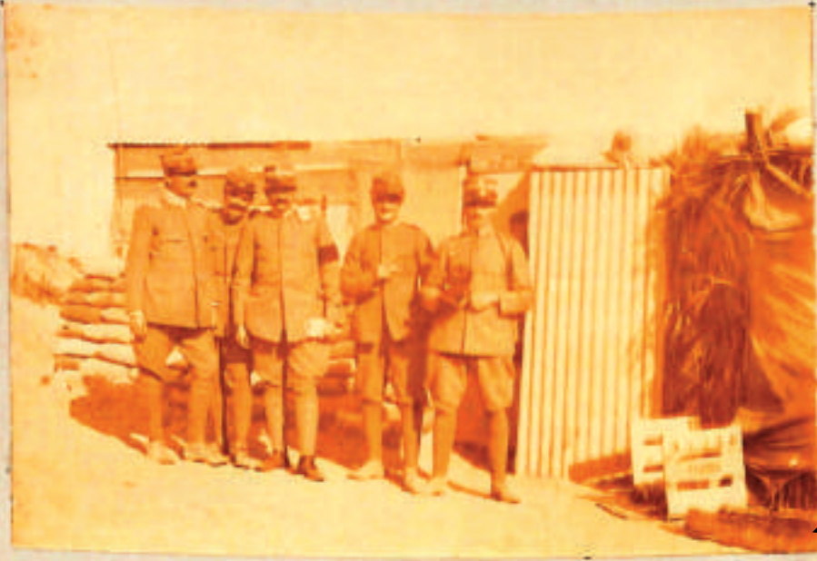
Mil 3° Ridotto del Campo Trincerato di Sidi Abi Semad - Messa ufficiali 11 a -