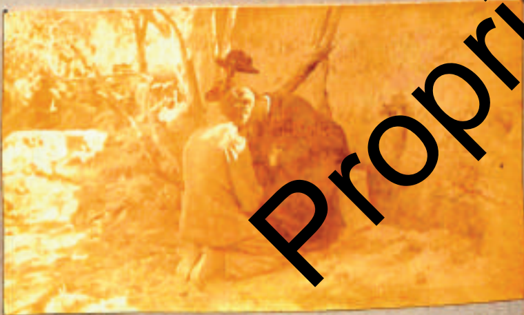
Completamento Libica -