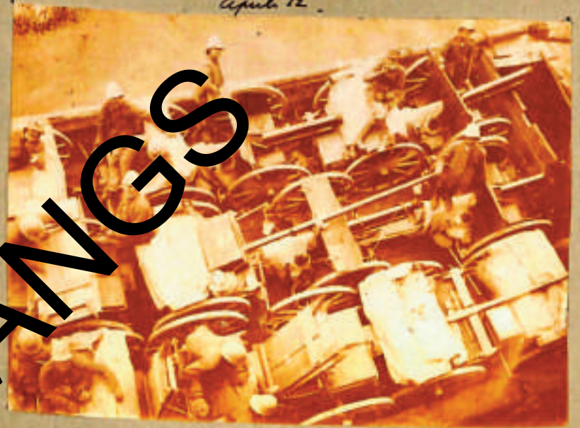
Batture 1906 - Bono - bordo Sannio - Aprile 12.