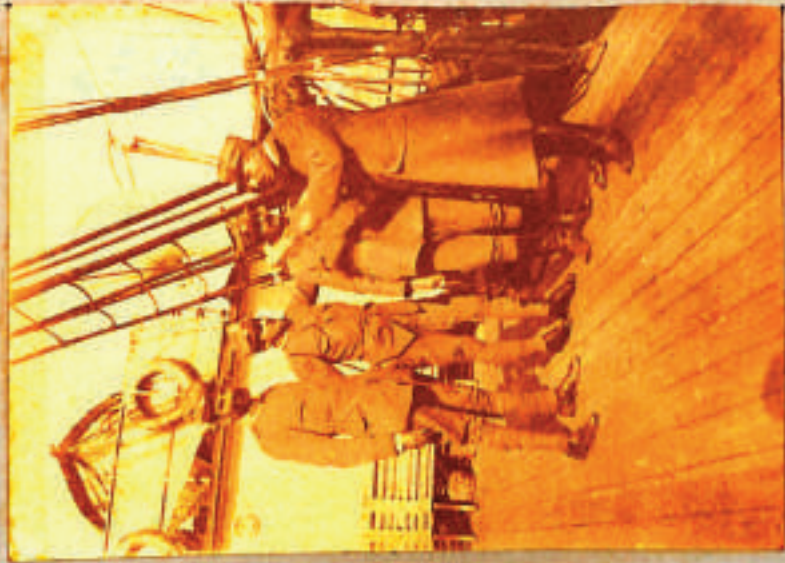
Bordo Sannio Aprile 12.