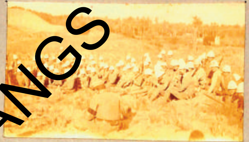
Il Com. 1. 11. parla ai suoi granatieri