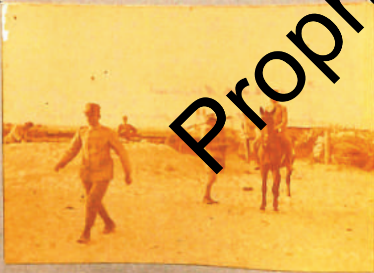
Mil 3° Ridotto - Il Com te la 11 a a rapporto dal Com te la 11 a -