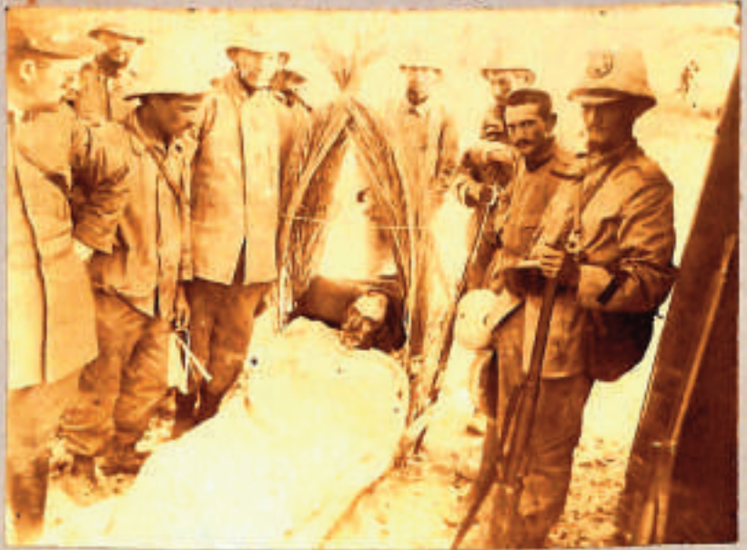
I valorosi della 11 a casata al M. Sagra - sepolti Sidi a Sidi