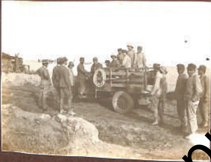
dopo l'anno di guerra i soldati salpano...