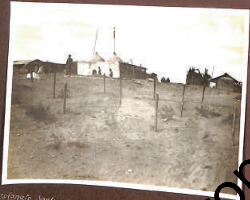
profanato Santuario della nobilita famiglia degli Innessa (adi...)