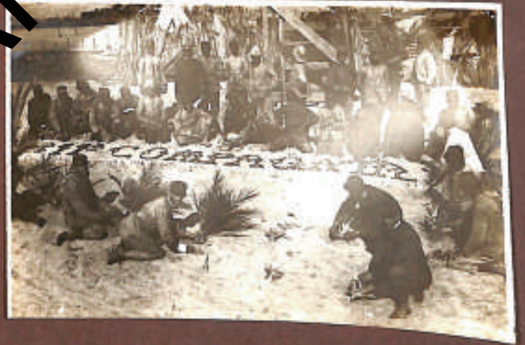
l'Arte di decorare le gabbie...