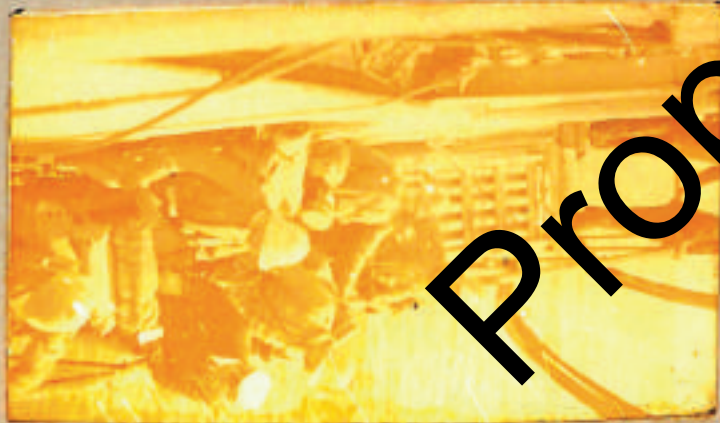
Costa di Macabee, Aprile 12