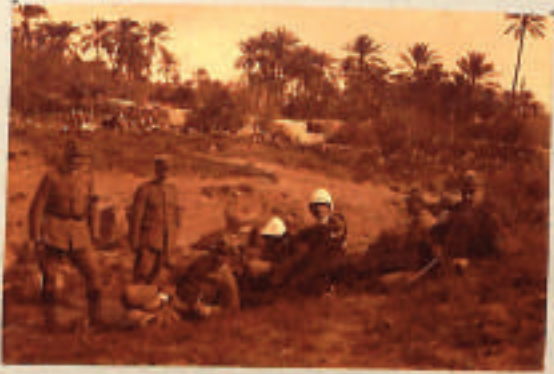
episodi del'asati Marzo 1942