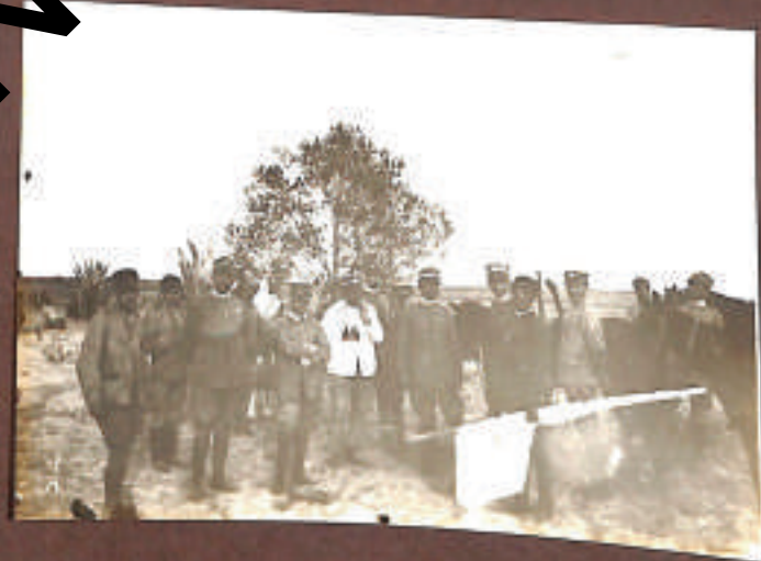
la Zaptie di scorta con l'insegna di pace del 18 ottobre