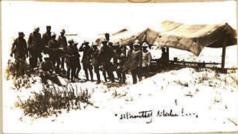
• Silhouette di barca