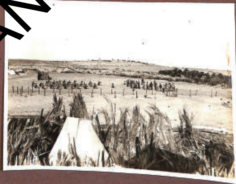
divagazioni giornaliere fra visioni belliche