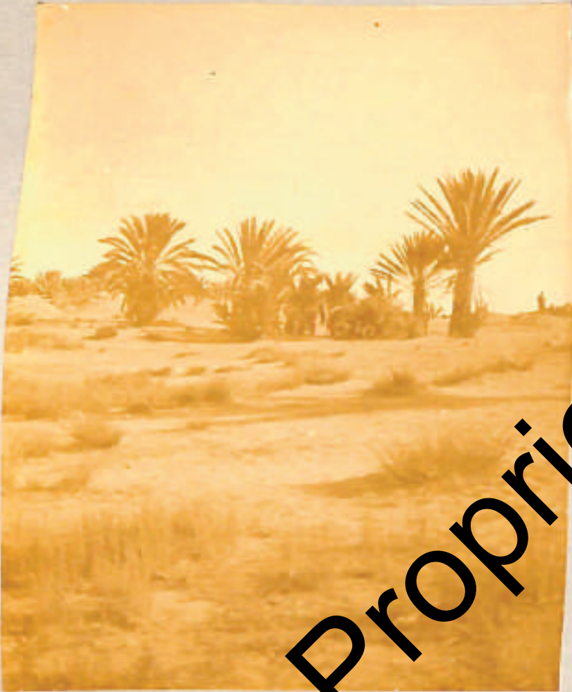
L'Oasi di Regda Pine -