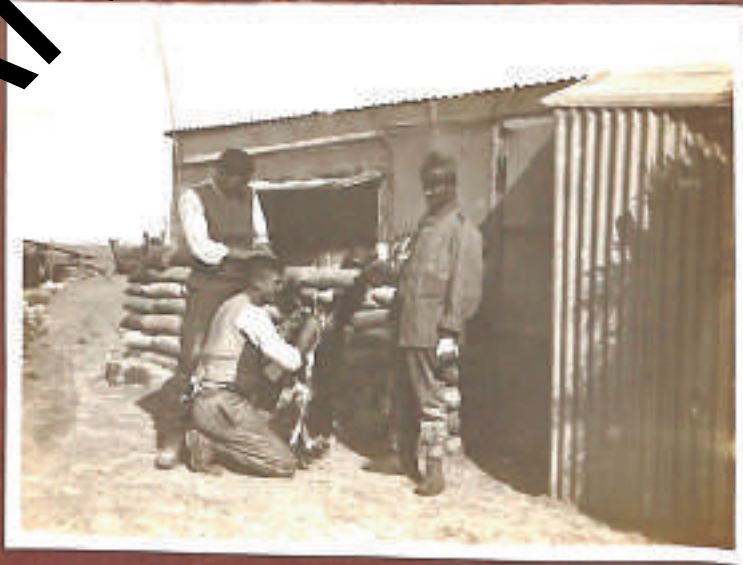
Un viale di messe (giocista di galle)