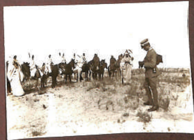
- Il nemico di ieri...