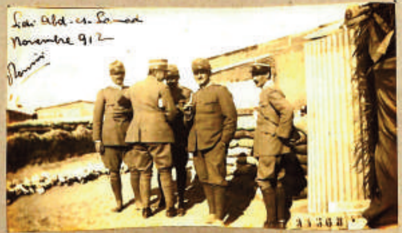
Sidi Abi Semad Novembre 912