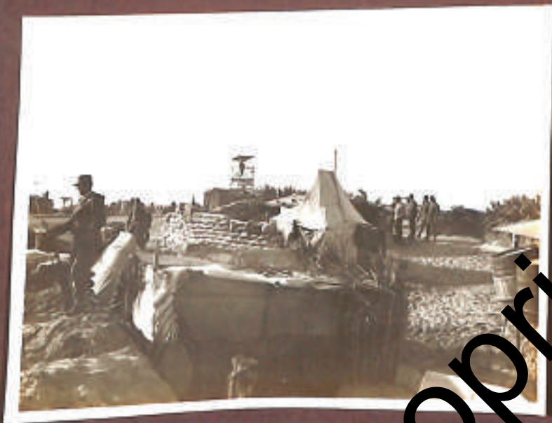
matteina in Ridotta