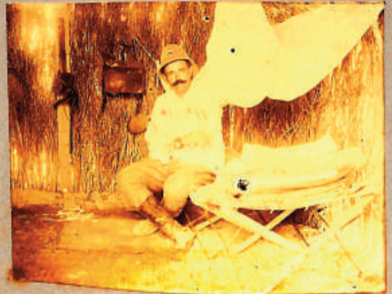
bit' sent agosto 1912