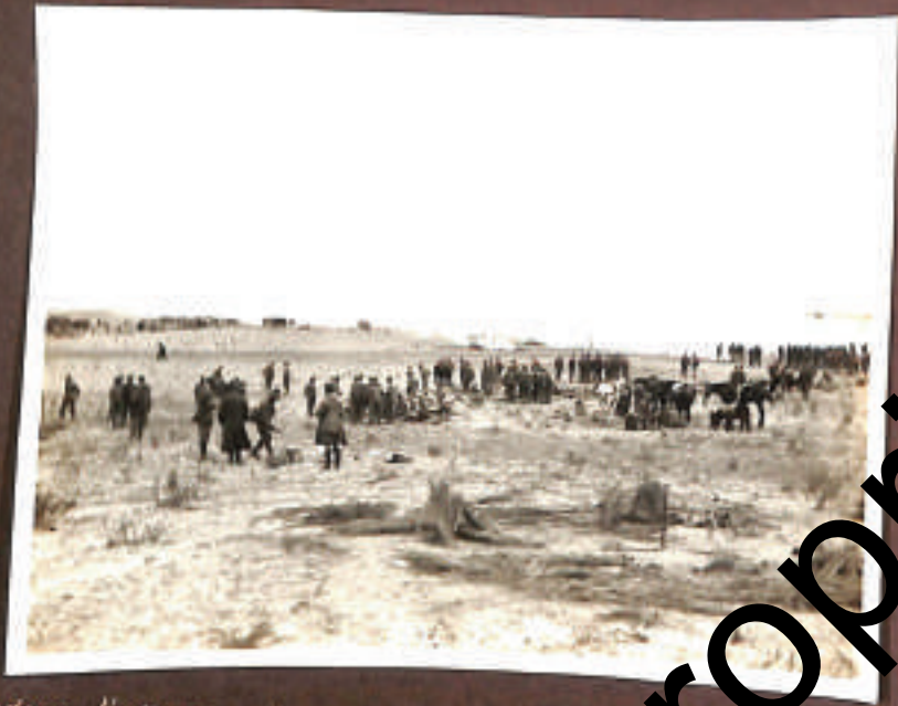
...vedano l'ultimo vestigio del dominio turco...