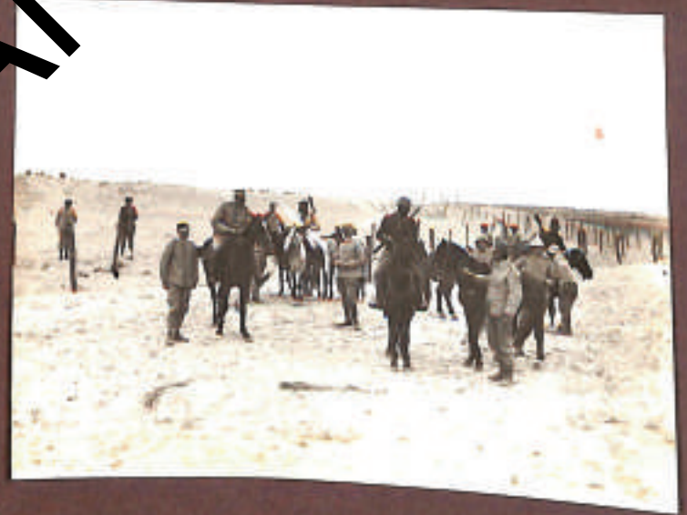
Losanne, al Ridotto IV.