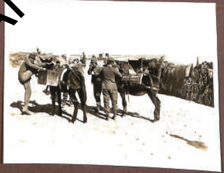
... e altri benemeriti...!