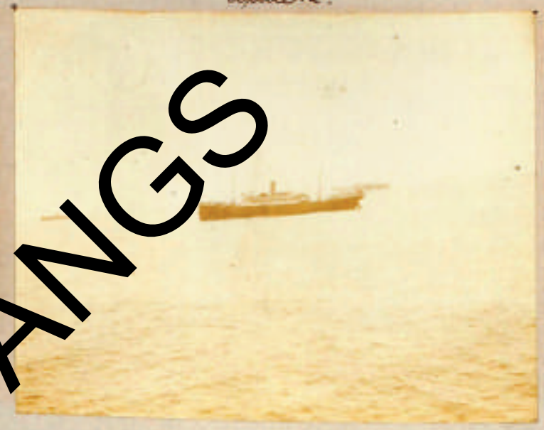
Davanti a Lucera - L'Hercules e i dirigibili Apule 12.