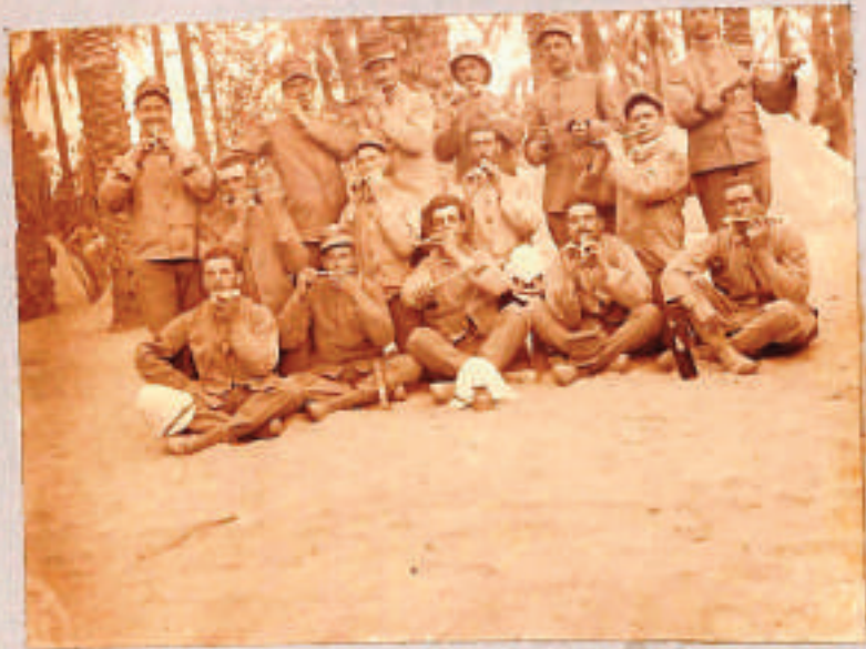
La fanfarrina della 11 a Comp a - nell'esp. di Hauri