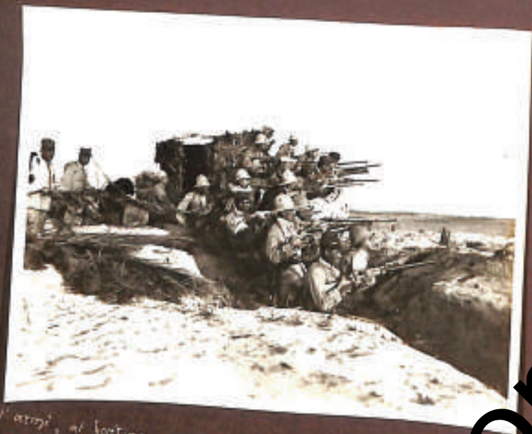
all'attimo, al fortino