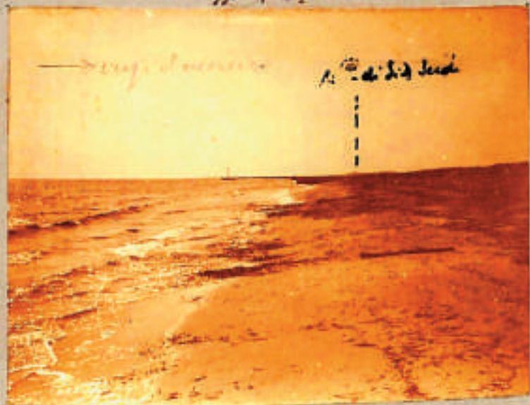
In ricognizione oltre le trincee di Mascher Maggio 1912.