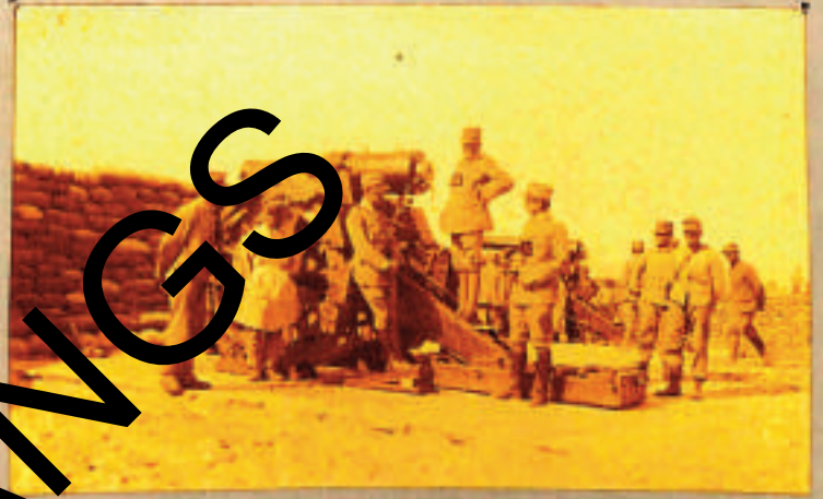
Legendo la posta - Maschica.