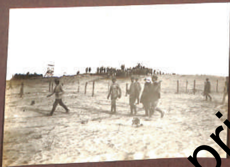
il primo parlamentare turco attorno a un albero secolare