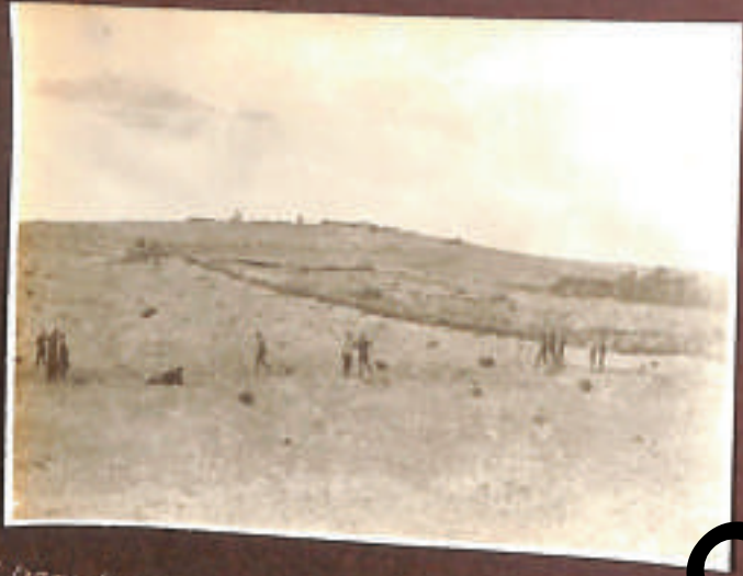
Luca di famiglia ...