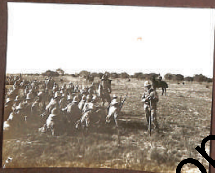
- Ras et Tabel (3/1)