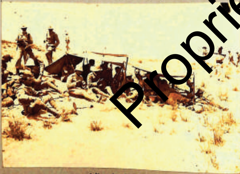
28. VI. 1912 -