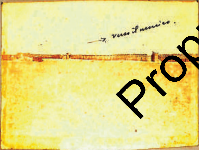
→ verso il nemico.