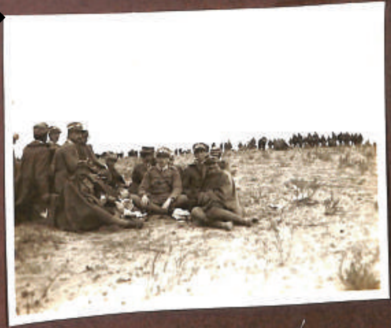
...e noi banchettiamo sulle ceneri di quelle barbarie...