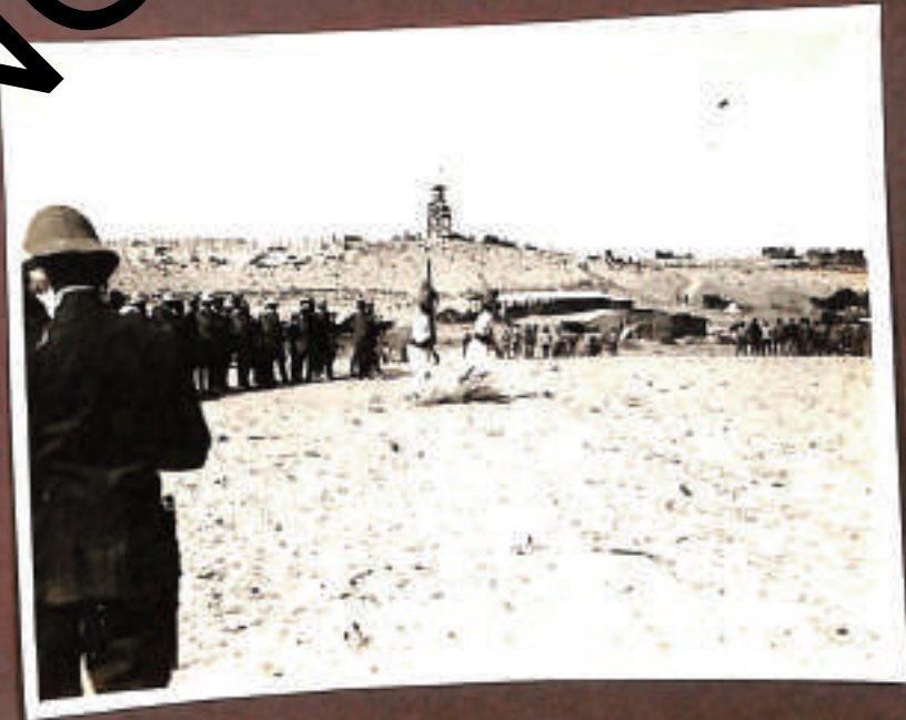
"Fantasia" degli Ascarri Eritreei in campo dei Granatieri (4 novembre)