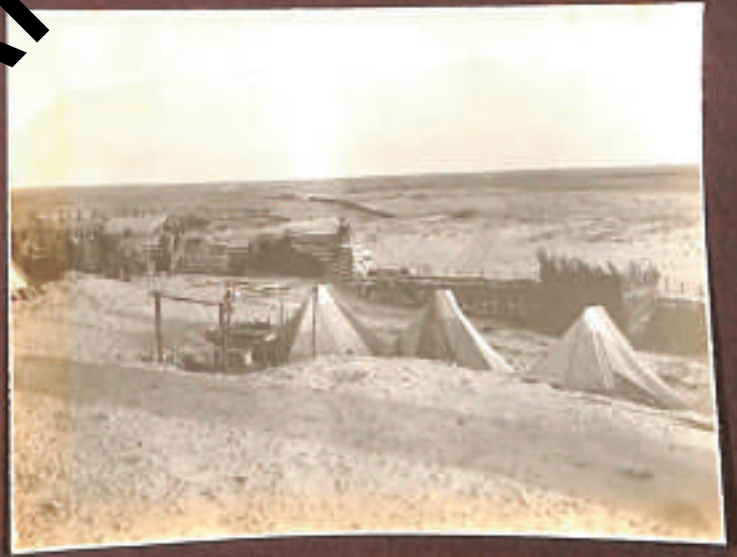
... ex Sidotto Rivello