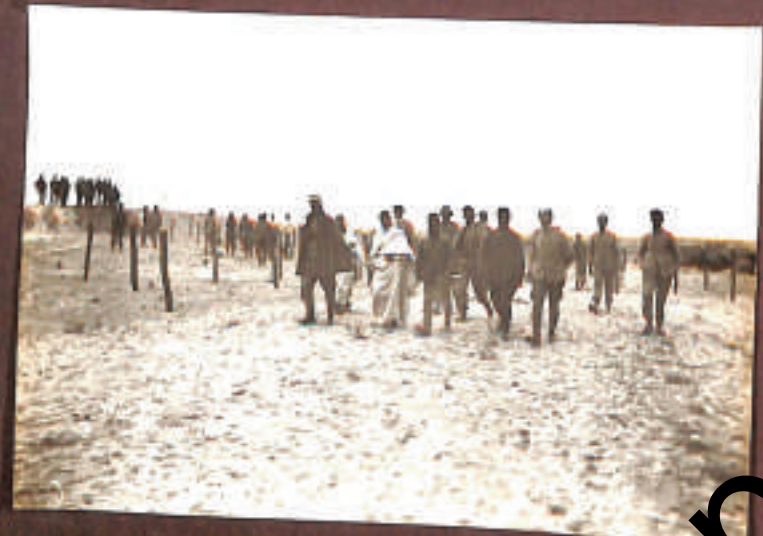
"Stane" del "Trettato" di