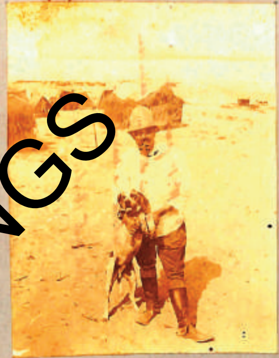
Spont del sott' accabene al Com o la 11 a