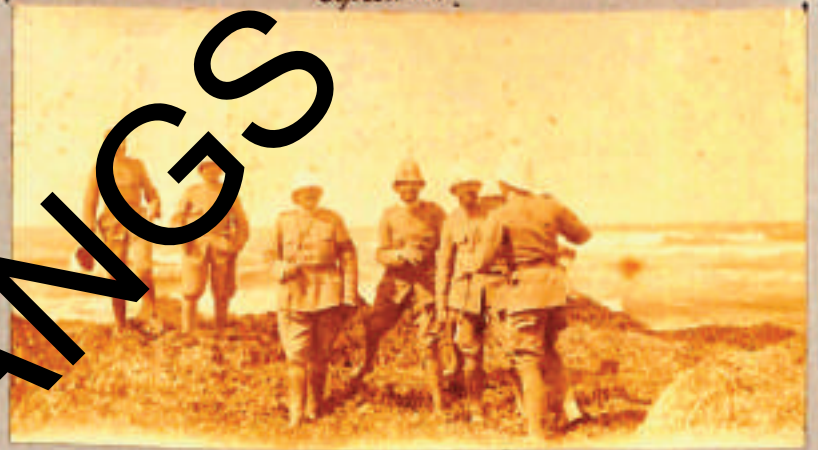
Sulle rive del golfo mediterraneo. Aprile 12.