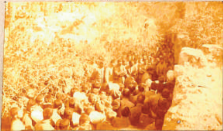
missione Libica -