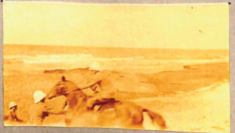
Un cavallo morto -