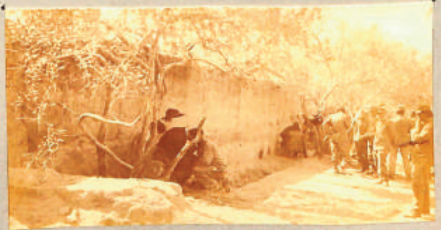
Confessione libica - Marzo 1942